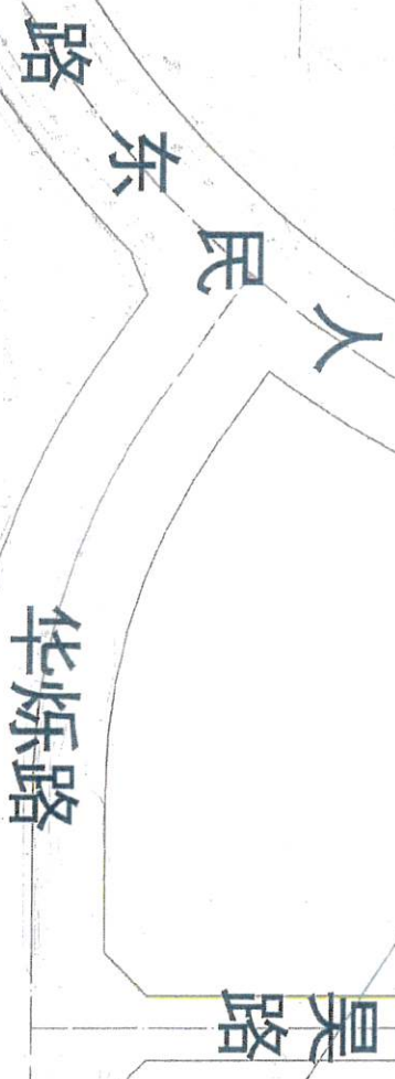
2011-12号地块项目建设规划绿线图